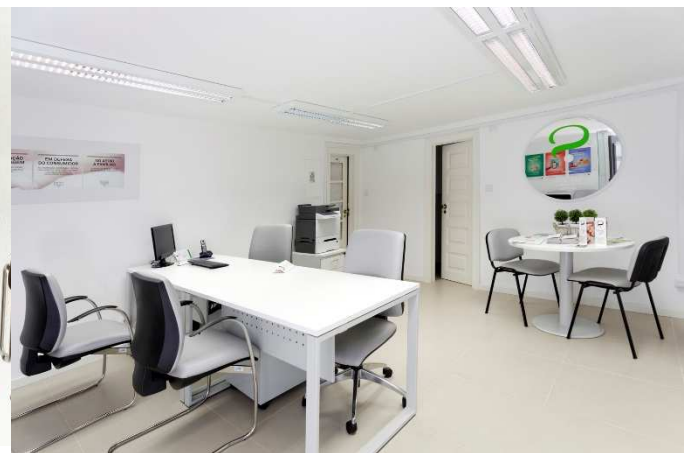
Instalações do Gabinete