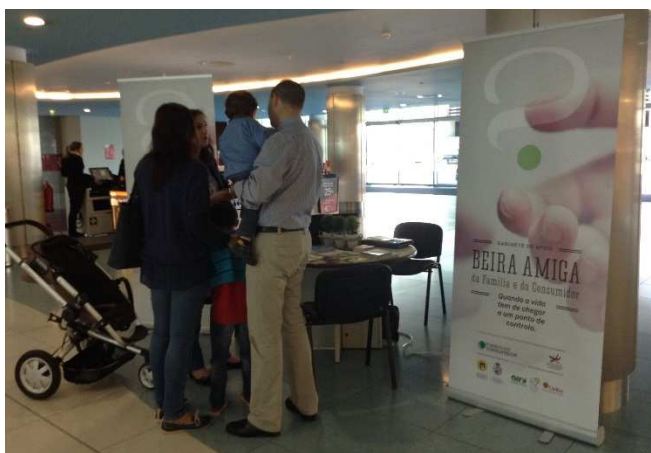
Informação à comunidade sobre os serviços prestados