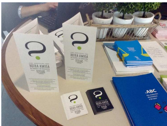
Panfletos informativos gentilmente cedidos pela Direção Geral do Consumidor, e sobre a BEIRA AMIGA